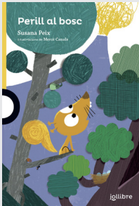
Perill al bosc Susana Peix

Un dels Objectius de Desenvolupament Sostenible busca assegurar la conservació, el restabliment i l'ús sostenible dels ecosistemes terrestres i els ecosistemes interiors d'aigua dolça i els seus serveis; en particular, els boscos, els aiguamolls, les muntanyes i les zones àrides.