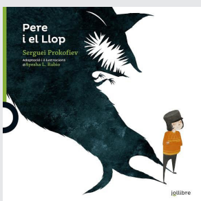
Pere i el Llop Sergei Prokofiev

La història de Pere i el Llop , de Sergei Prokofiev, pot ajudar els infants a reflexionar sobre l'existència en la natura d'una cadena alimentària on unes espècies depenen d'altres. A més, fa prendre consciència que, de vegades, les persones intervenim en la natura per trencar aquesta cadena en benefici propi, actuació que genera problemes seriosos a la resta d'espècies de l'ecosistema.